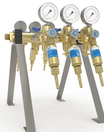
avec 4 ou 6 points de sortie Universal V6